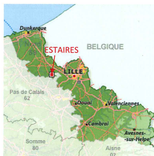
Carte 1. Situation de la commune de Estaires

L'annexe 3 présente le plan de situation au 1/25 000 ème .